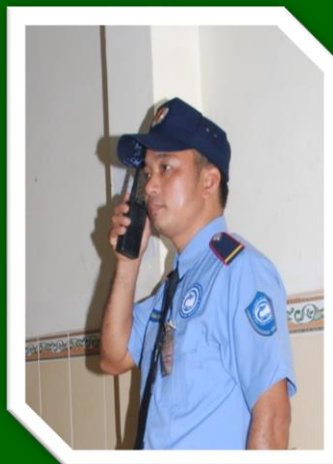
Hình 22: Kiểm tra tình trạng Bộ đàm, máy rà Kim loại....