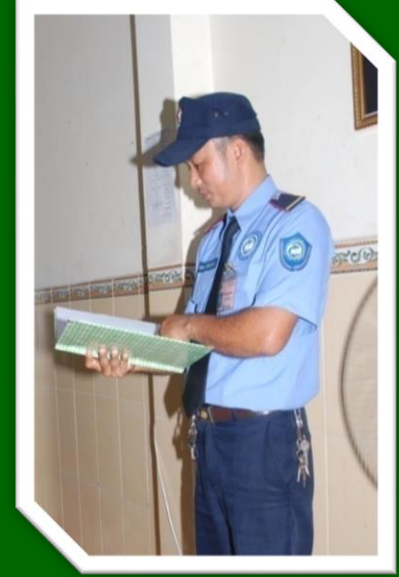
Hình 32 Ghi chép ngay tình trạng tại khu vực tuần tra khi mỗi lần kiểm tra.