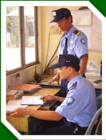
Hình 21: Kiểm tra sổ sách