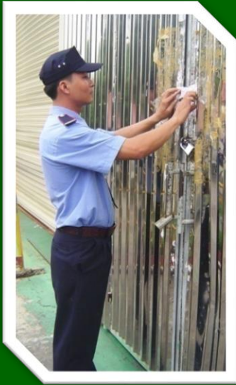
Hình 30 Kiểm tra các niêm phong, khóa cửa