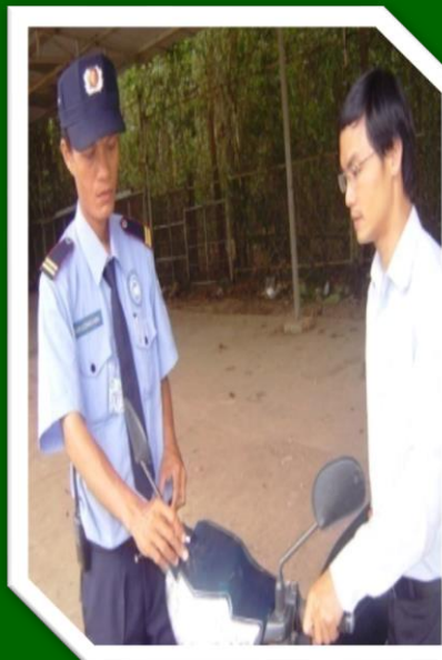
Hình 27 Kiểm tra khám xét khách và phương tiện ra vào nhà máy