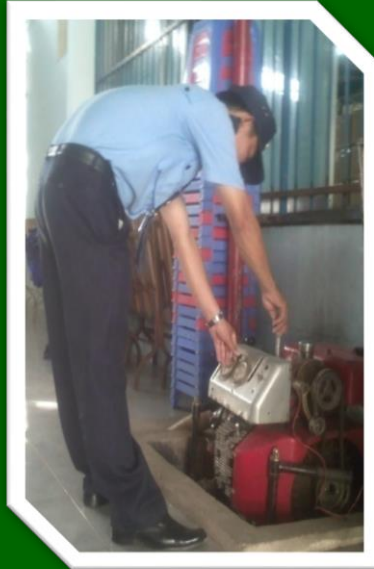
Hình 25: Kiểm tra tài sản khi nhận bàn giao