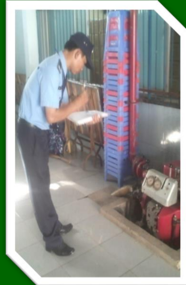
Hình 26: Ghi nhận tình trạng hoạt động của máy móc thiết bị để bàn giao cho ca sau