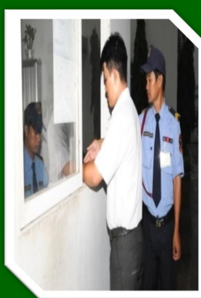
Hình 28 Làm thủ tục đăng ký cho người và phương tiện ra vào.