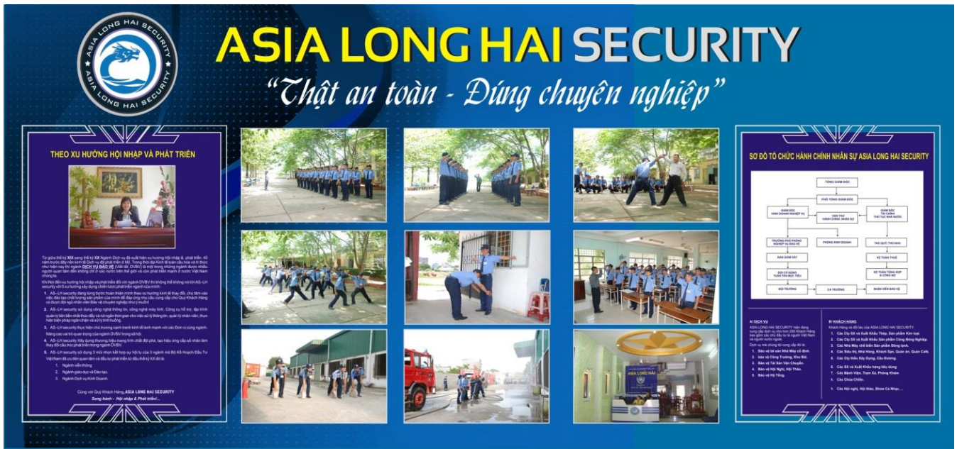
Hình 37: Phương pháp đào tạo nghiệp vụ bảo vệ chuyên nghiệp

Ban Giám Đốc Công ty ASLH liên tục đầu tư tài chính và tâm huyết vào khâu chủ chốt cho việc huấn luyện và trang bị kiến thức nghiệp vụ cho nhân viên theo đúng quy định của nhà nước và tài liệu của Bộ Công An đưa ra.