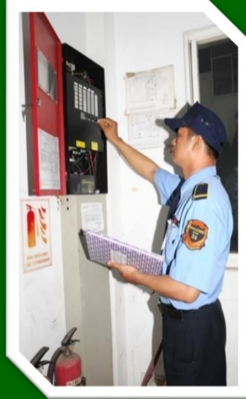
Hình 31 Kiểm tra các hệ thống báo cháy