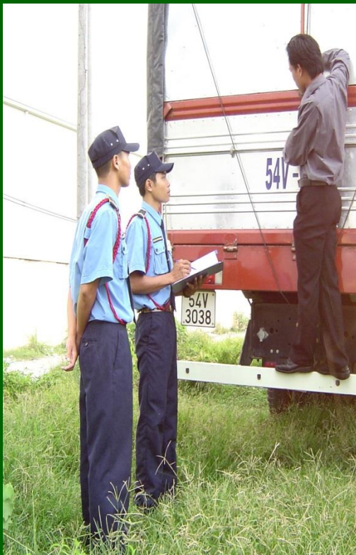
Hình 36: Kiểm tra và phát hiện có sự cố