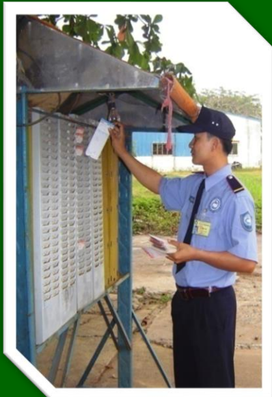
Hình 24: Kiểm tra thẻ công nhân khi bàn giao ca