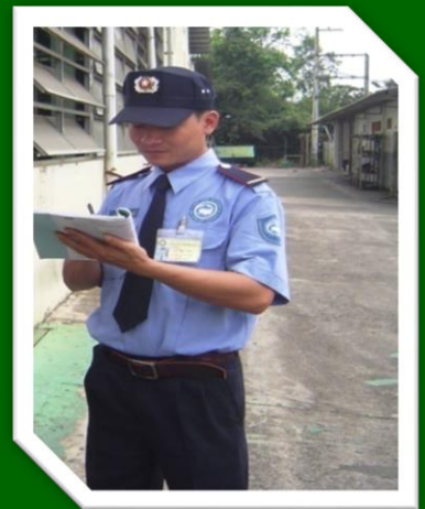
Hình 23: Ghi chép ngay tình trạng tài sản được bàn giao khi mỗi lần kiểm tra