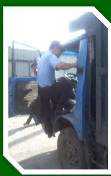
Hình 29 Kiểm tra kỹ các phương tiện khi ra vào nhà máy